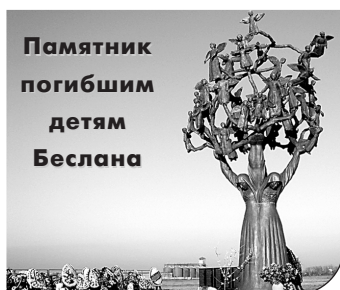
Памятник погибшим детям Беслана

Так почему же террористов называют словом «нелюди»?